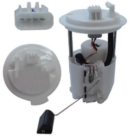
EU-57661 ALTA PRESIÓN