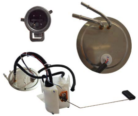
EU-58287 ALTA PRESIÓN